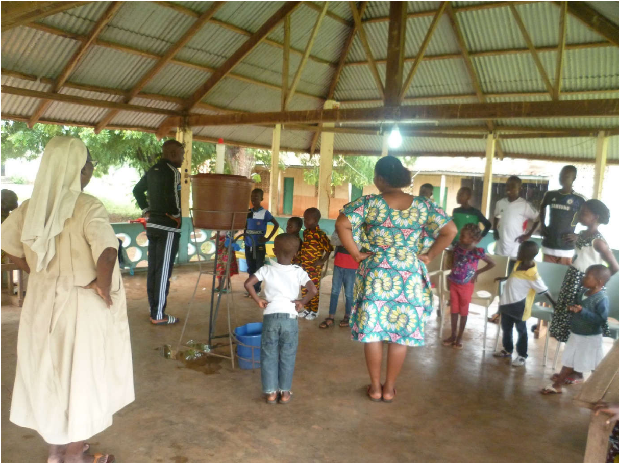
RECREATION EN COMPAGNIE DES OEV