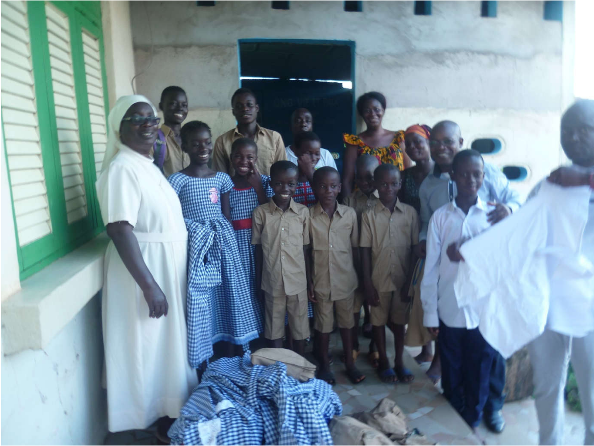
MERCI MAMAN FNLS