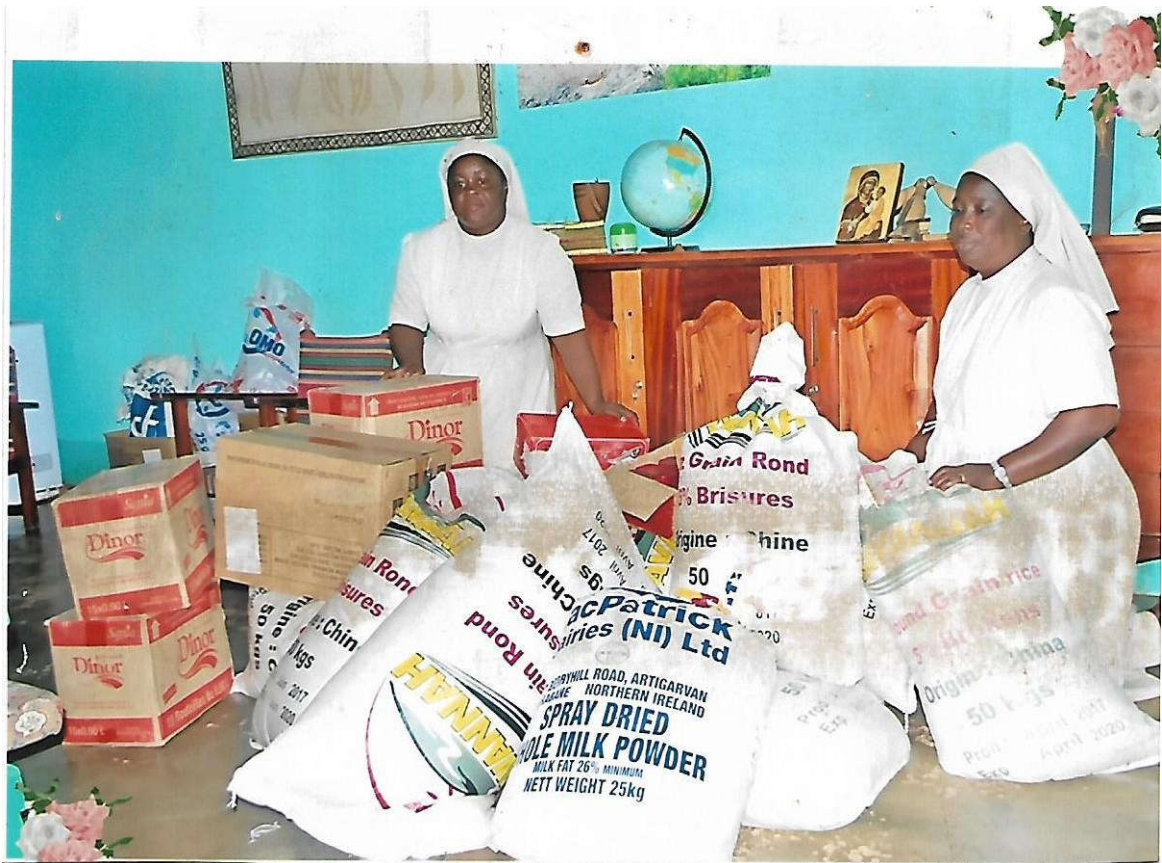
APPUIS ALIMENTAIRE PNOEV 2017