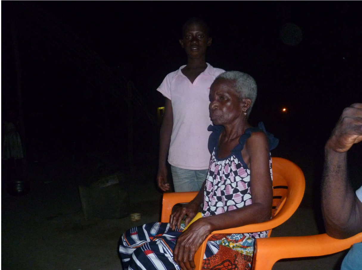
VISITE A DOMICILE ET SUIVI DES OEV DANS LA COMMUNAUTE