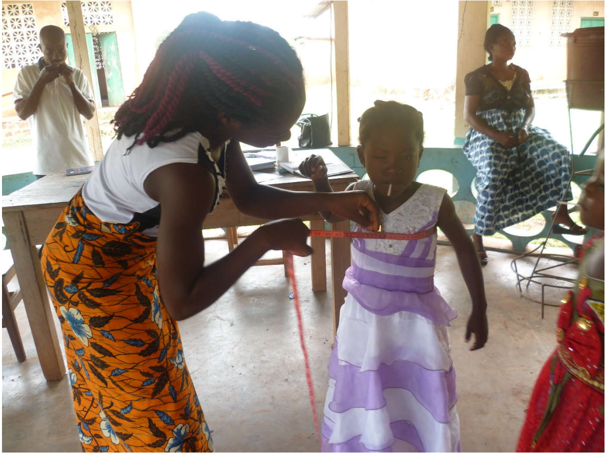
TENUE SCOLAIRE FNLS 2019