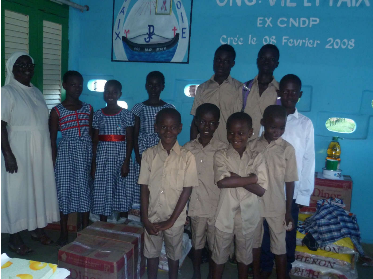
TENUE SCOLAIRE FNLS 2019