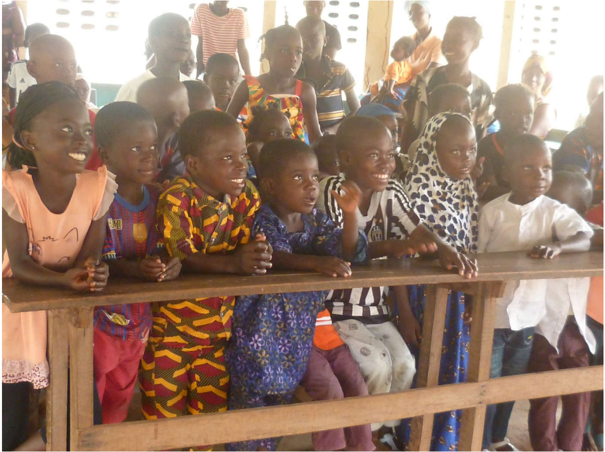
GRUPE DE SOUTIEN OEV.