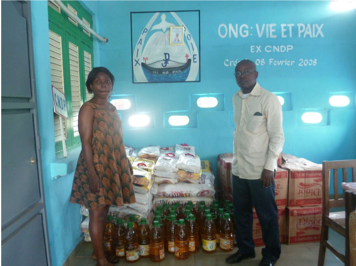
KITS ALIMENTAIRE FNLS 2020