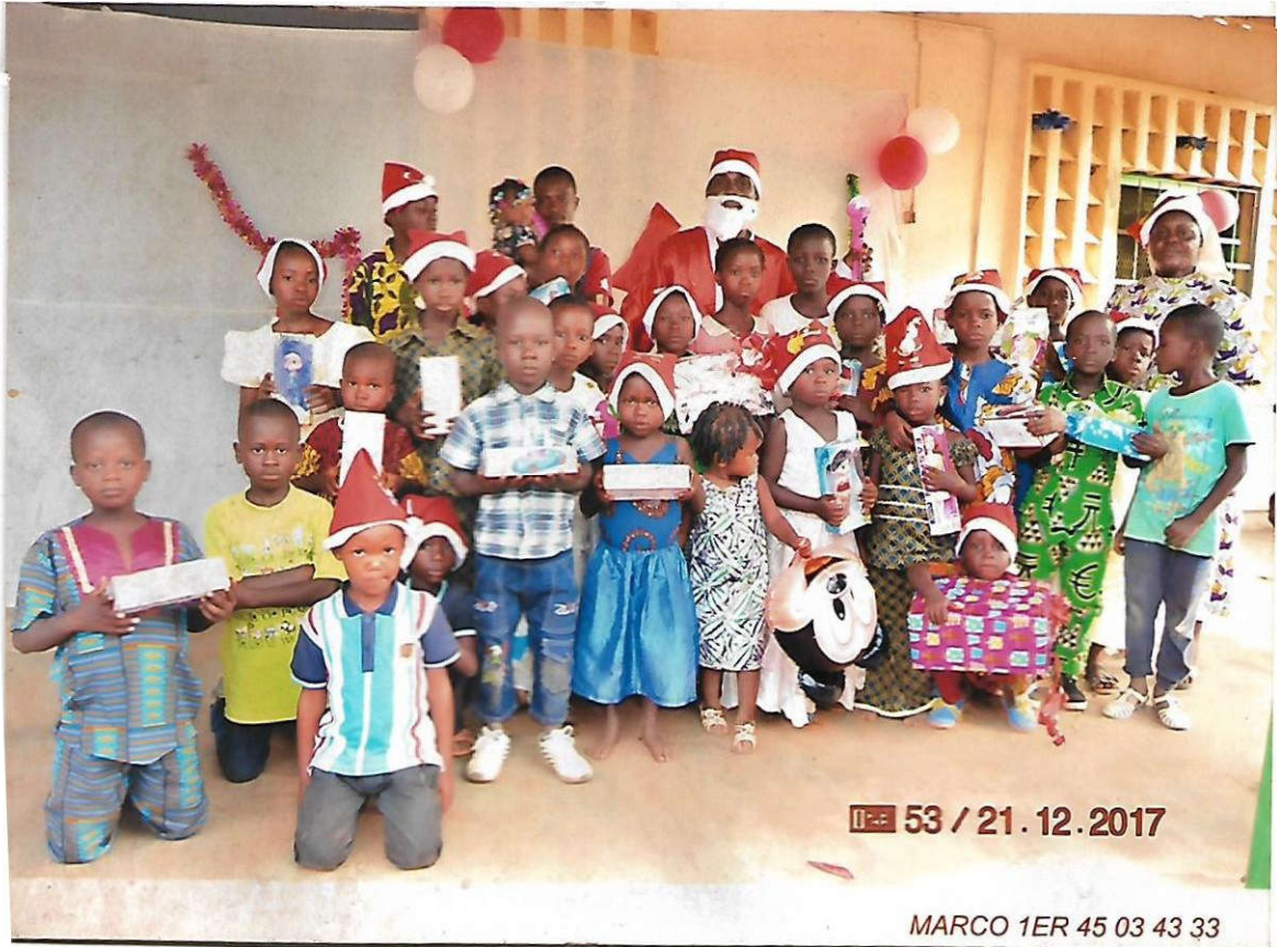
ARBRE DE NOEL SEVCI 2017