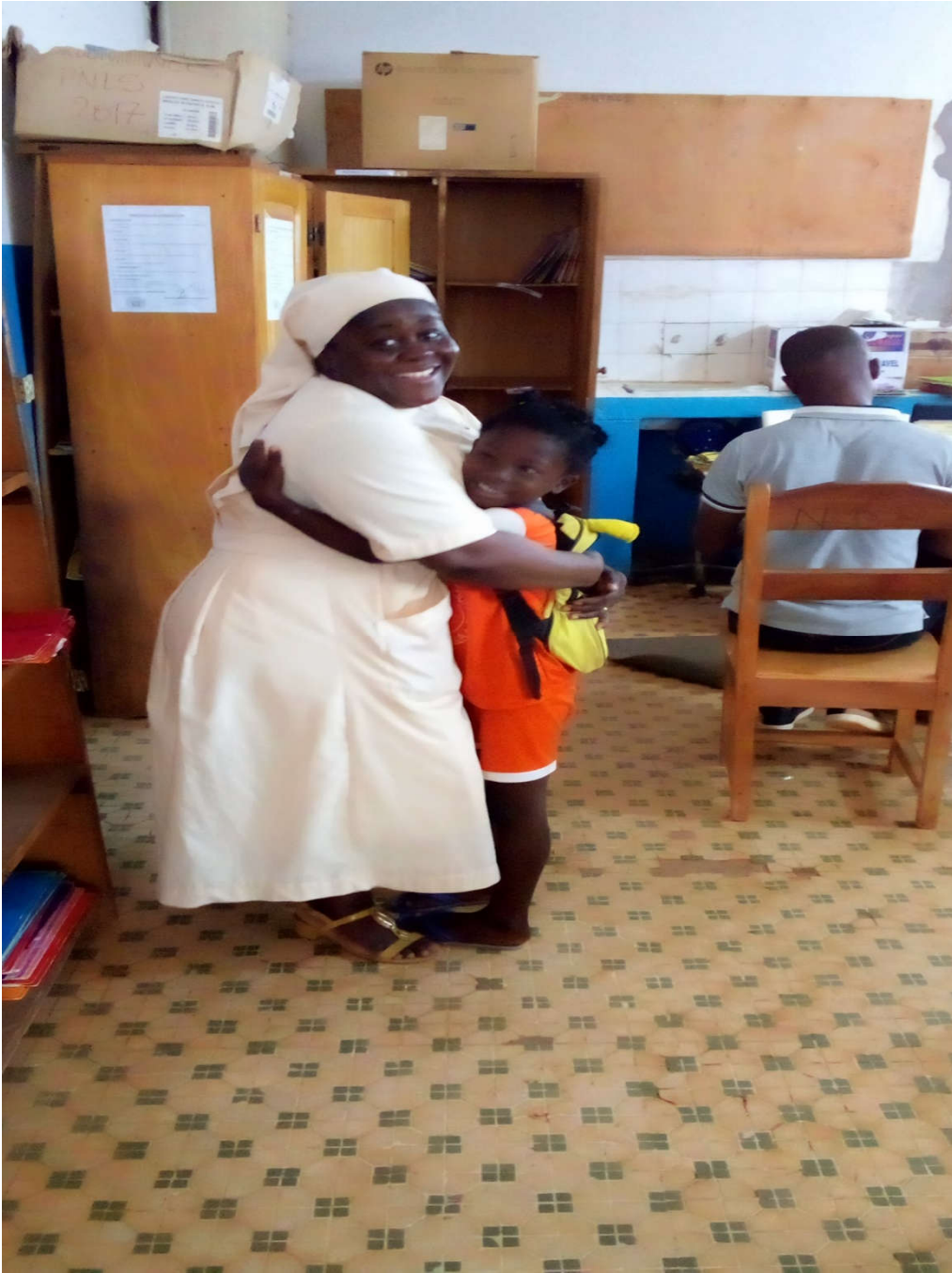
Encouragements et félicitations FNLS (1ere de classe).