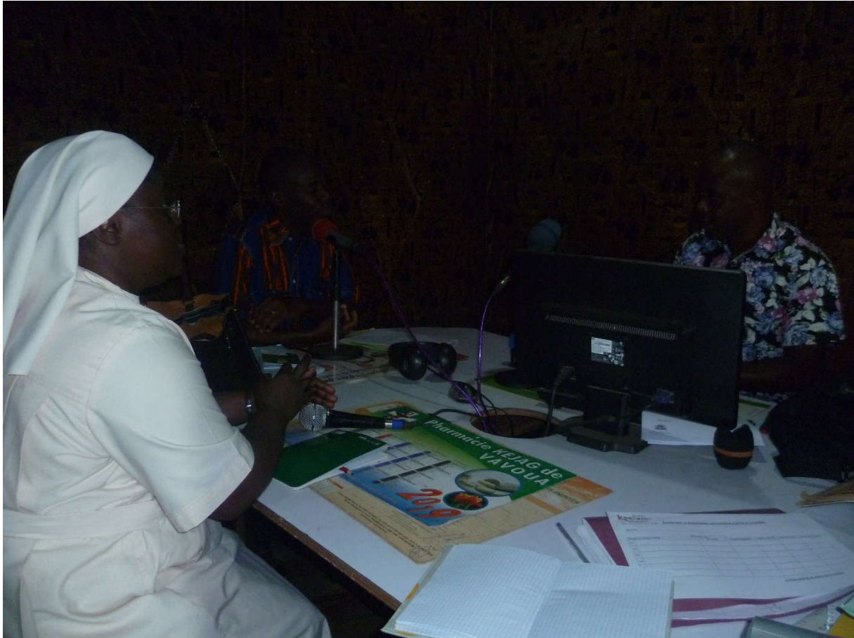
EMISSION RADIO (SENSIBILISATION SURVIH) 1 ER DEC.