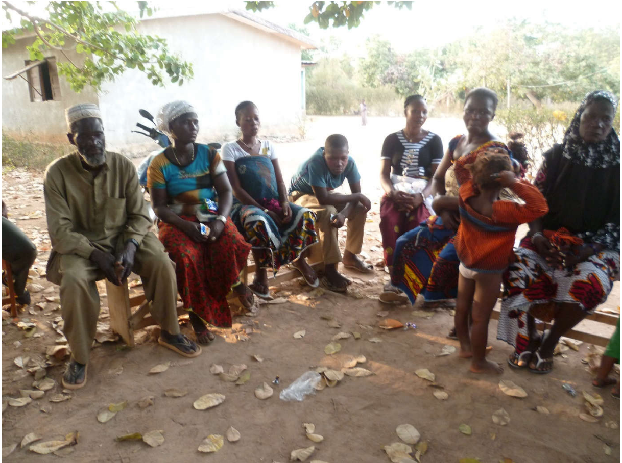
GRUPE DE SOUTIEN ADULTE (ANCIEN-PROZI SEVCI 2014)