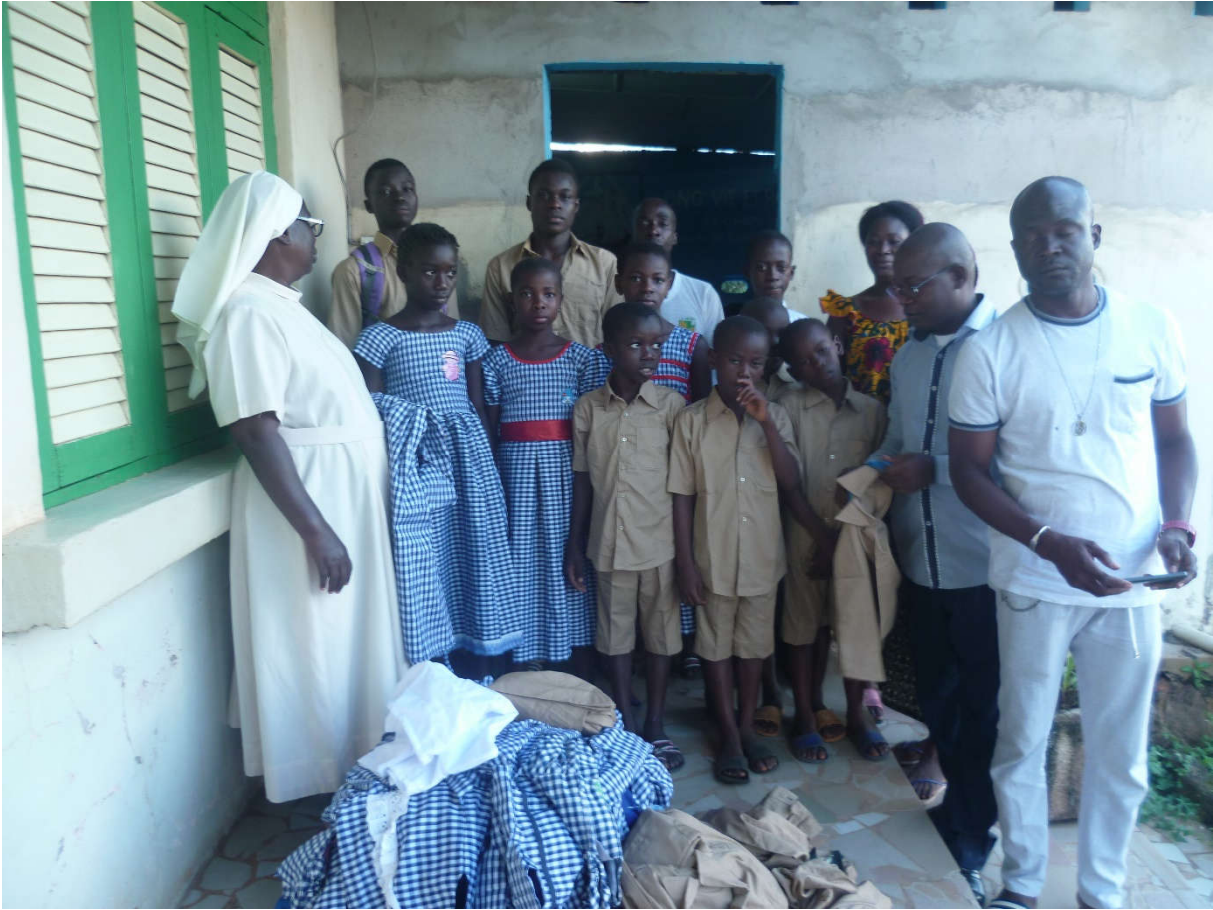
TENUES SCOLAIREFNLS 2019