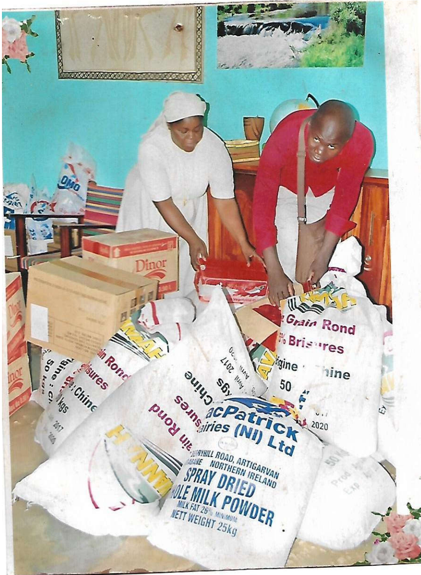
APPUIS ALIMENTAIRE PNOEV 2018