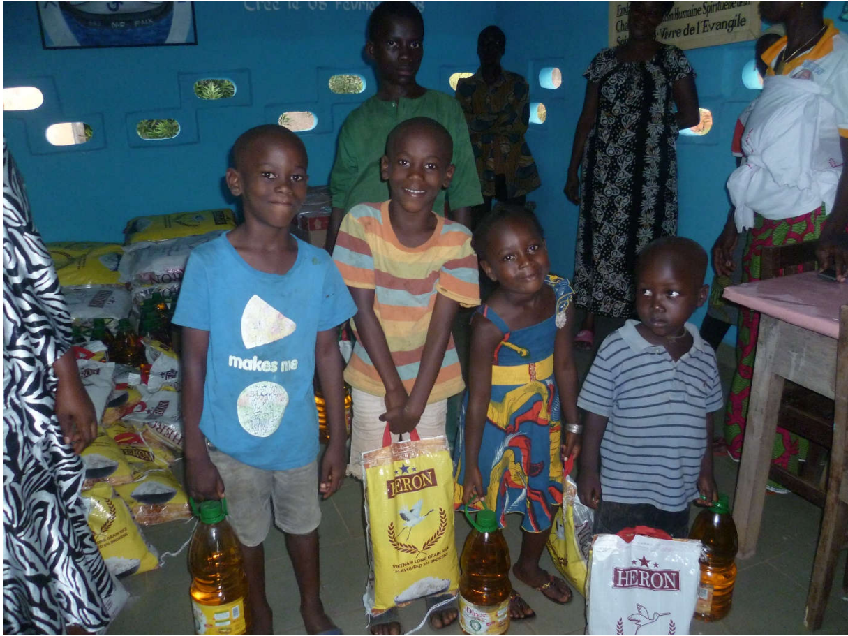
KITS ALIMENTAIRE FNLS 2019