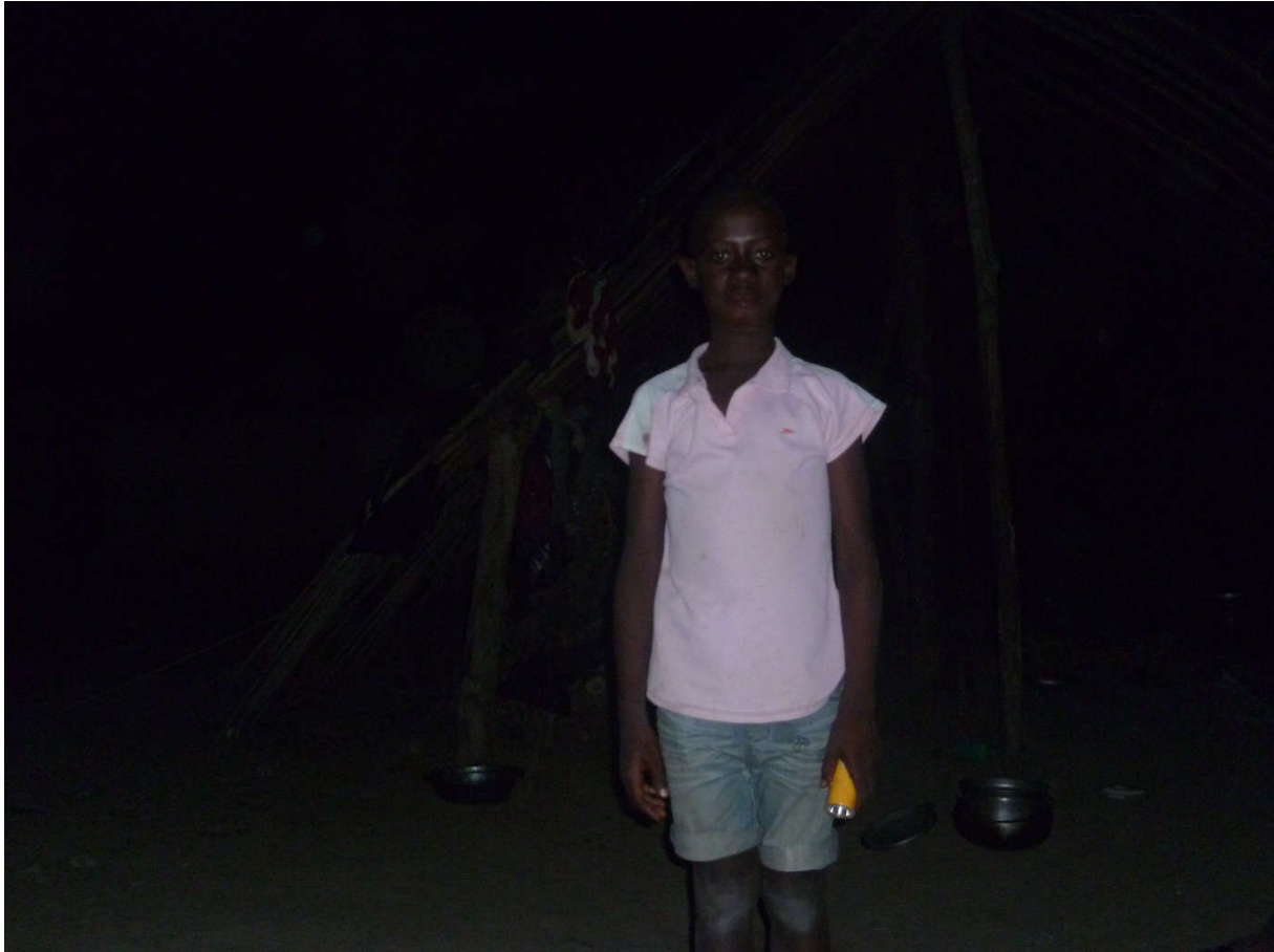
OEV : EN CLASSE DE 5 E AU COLLEGE SAINT MARTIN DE VAVOUA .(ONG :VIE ET PAIX)