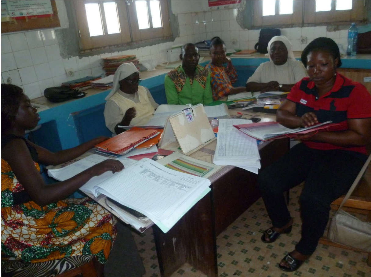
SEANCE DE TRAVAIL SEVCI 2018