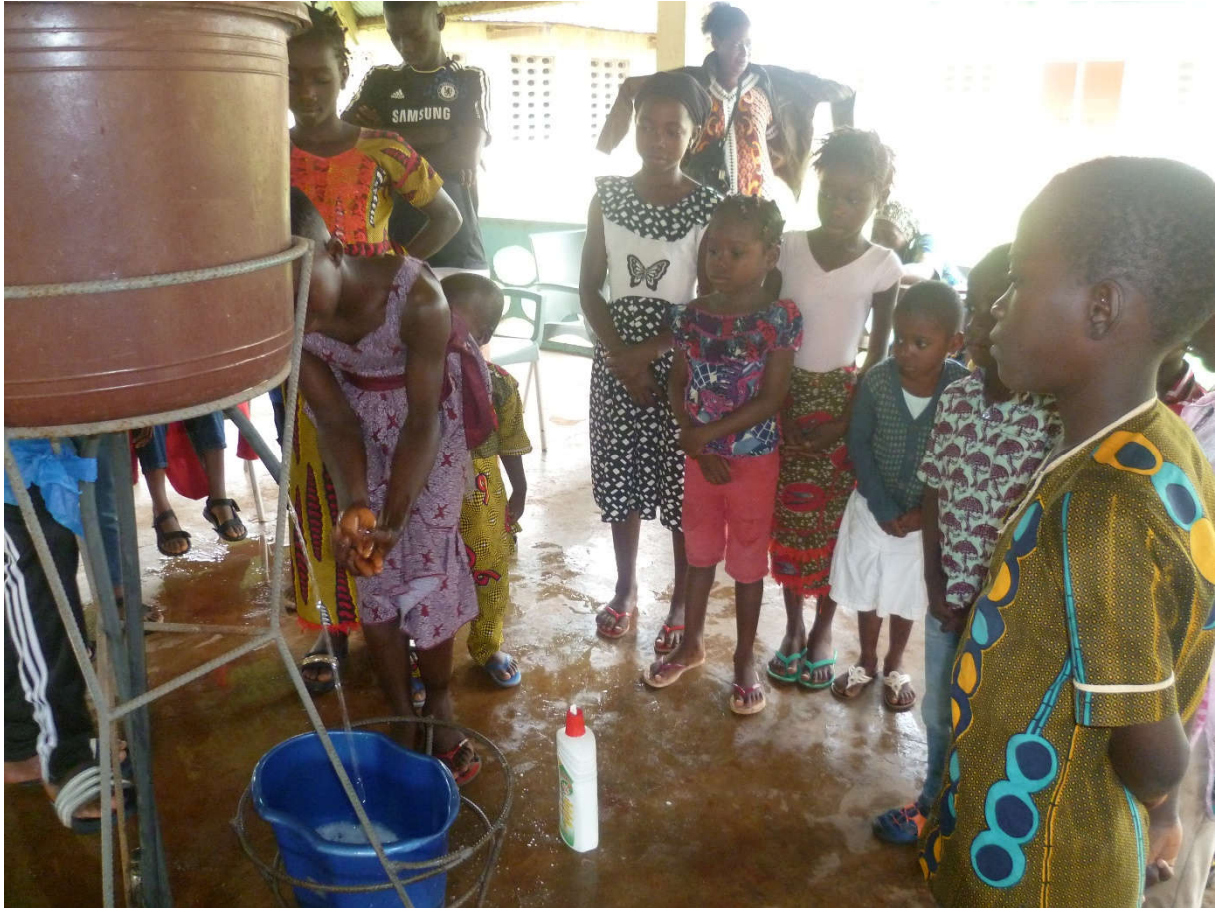
GRUPE DE SOUTIEN OEV (le lavage des mains et l'hygiène corporel) FNLS2019.