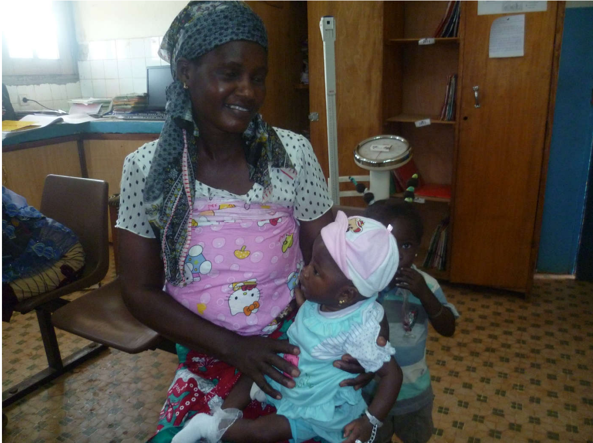
SUIVI DESOEV ET LEUR FAMILLE. (RENOUVELLEMENT ARV)