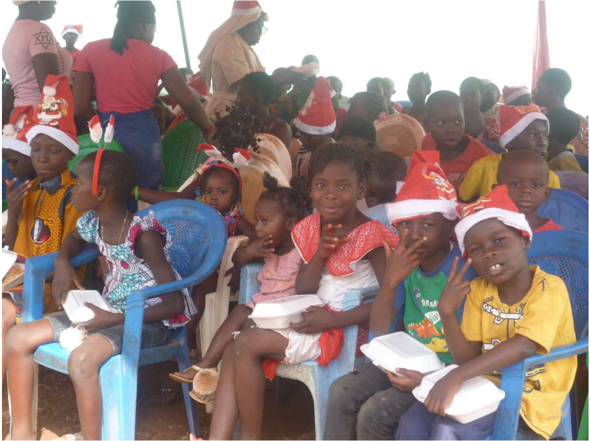
ARBRE DE NOEL FNLS 2019.