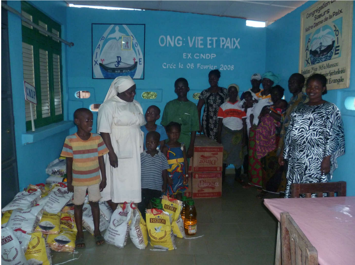
KITS ALIMENTAIRE FNLS