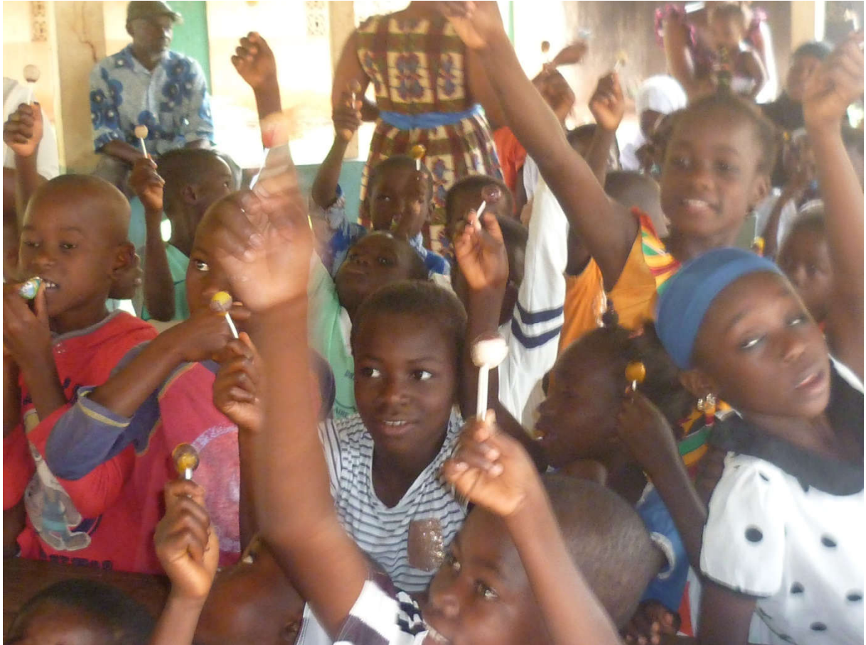
GROUPE DE PAROLE OEV FNLS 2019