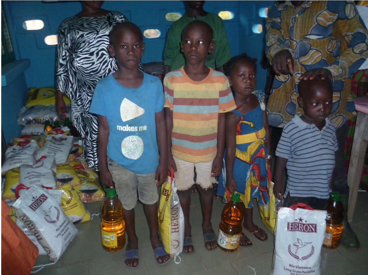
KITS ALIMENTAIRE FNLS 2019