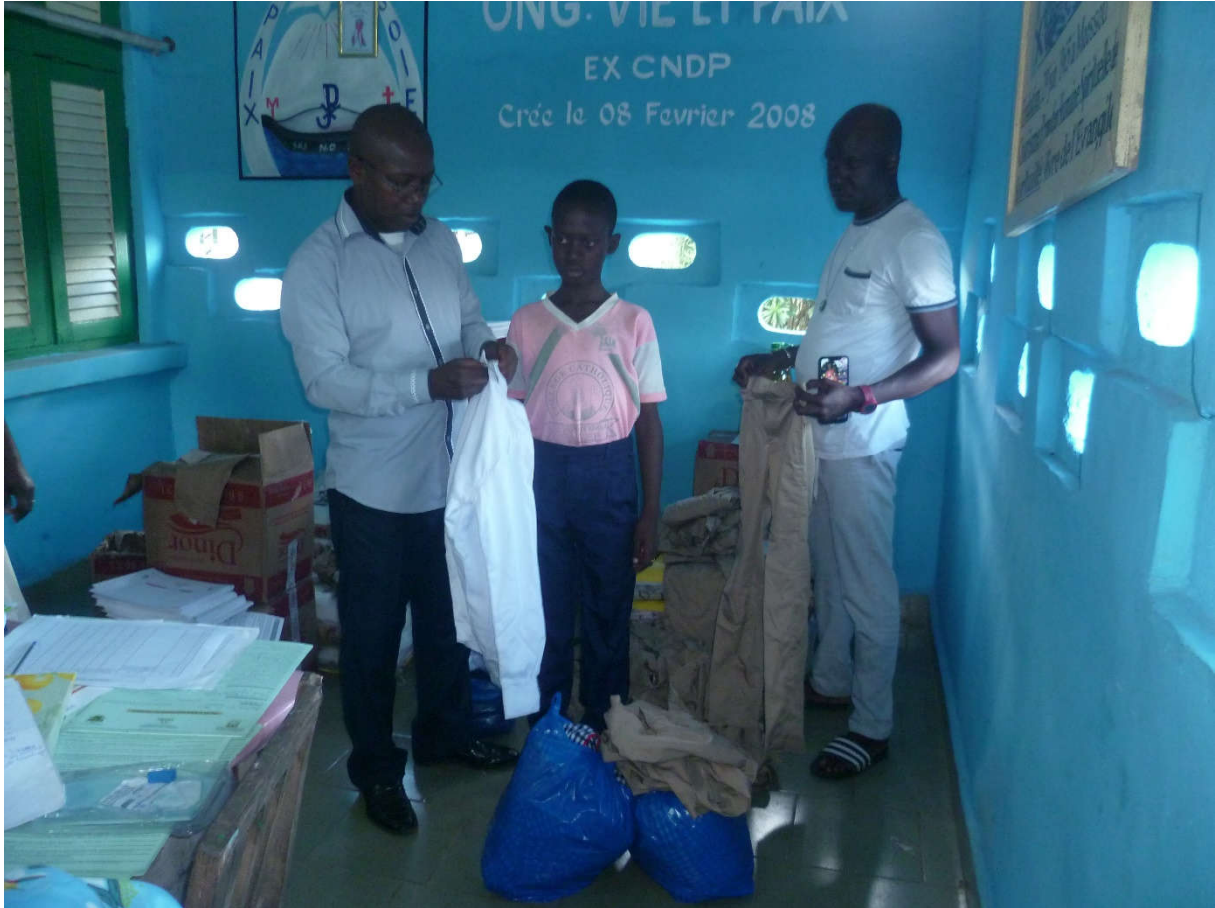
TENUE SCOLAIRE FNLS 2019